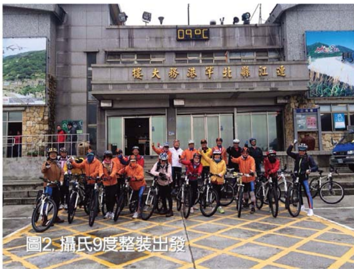
圖2.攝氏9度整裝出發

長一得知我們腳踏車無法運達，馬上請他們馬祖自行車推廣協會的會長，在一日之內把馬祖全島的腳踏車收集過來，借給我們騎。真的讓我們驚訝萬分，也充份感受到馬祖人的熱情。