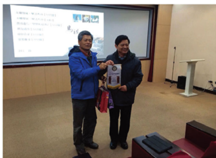
20屆社長polylon代表致贈縣府禮物

縣長還邀我們到縣政府參觀(圖4.5)，每人送我們一份紀念品，還帶我們參觀馬祖文物館，親自爲我們解說，最近在馬祖發現8000年前的人類遺跡。原來馬祖比我們想像中進步多了，不但歷史悠久，街道也非常乾淨，尤其在海邊的小山城一芹壁村閩東式的建築很有味道，像極了希臘的聖多里尼島。