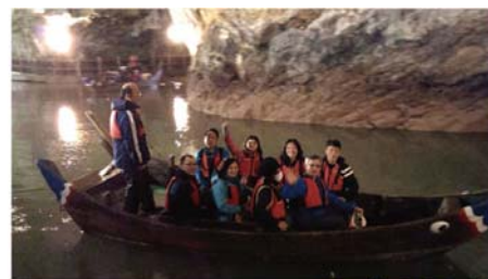
圖8.北海坑道坑道內全是由花崗岩挖鑿而成，由此可見當時工程之浩大(圖7)。

今天是最後一天的行程了，一早起來，看到可愛的陽光，大家都好開心，可以騎車了。我們立刻整裝出發往海邊的自行車道前進。沿途欣賞濱海的美景，享受難得一見的陽光，又沒有北竿高低起伏的山坡，真是暢意愉快的騎乘。雖然只是短短一個上午騎車，但是卻讓全隊士氣大振，一路衝上雲台山，毫不退縮。(圖8)