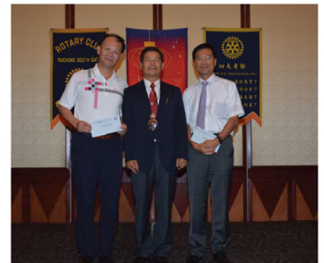
▲ 出席摸彩幸運中獎