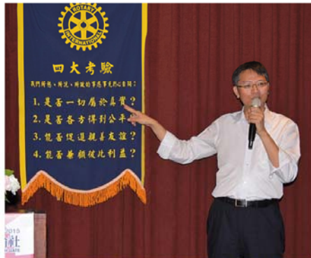
▲微熱山丘精神和扶輪四大考驗一樣

文創價值是品牌的好機會，而且電子商務的興起也給了全新的方式。微熱山丘是我們一場遇見百倍契機的精彩實驗……。