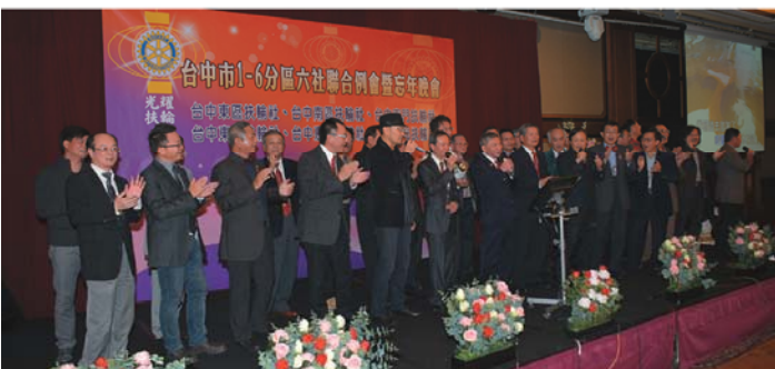
大合唱社友夫人伴舞