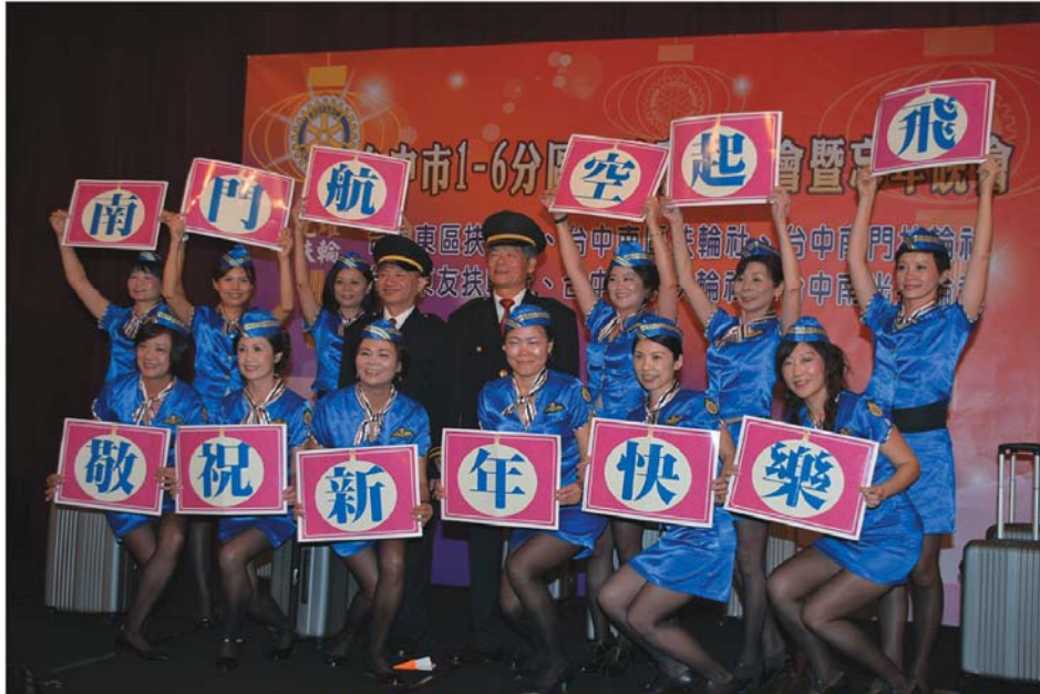
▲「南門航空起飛，敬祝新年快樂」的精彩表演節目