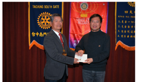
▲謝謝認養扶輪之子▼

* 3460地區總監感謝認養扶輪之子15位社友，上週請社長頒發感謝獎章給：SPINDLE、LAWYER、RUDY、LIVING、HEALTH、PHARMA、COPPER、LOBSANG、RICH、POSTER、FAITH、KENCHIKU、POWER。