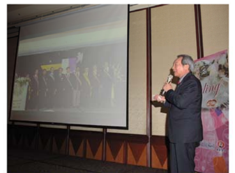
▲RUDY前社長南門第五年風華分享

元月份壽星是：Pharma夫人、Alumi夫人(1月7日)，Packing社友(1月8日)，Lapping社友(1月10日)，Printing夫人、Doctor夫人(1月13日)，Biotek社友(1月15日)，