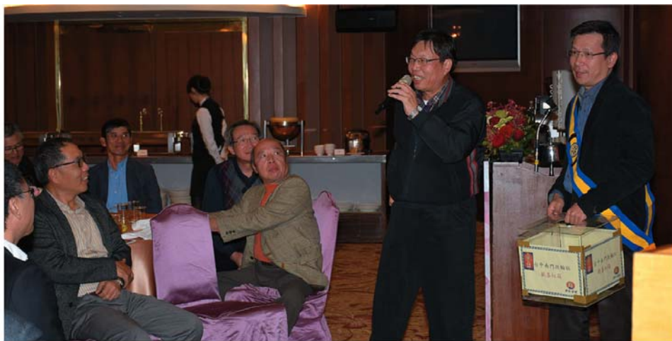
內輪會剪影 103-0816電影與音樂的美麗交會 103-1018喜樂人生秘訣