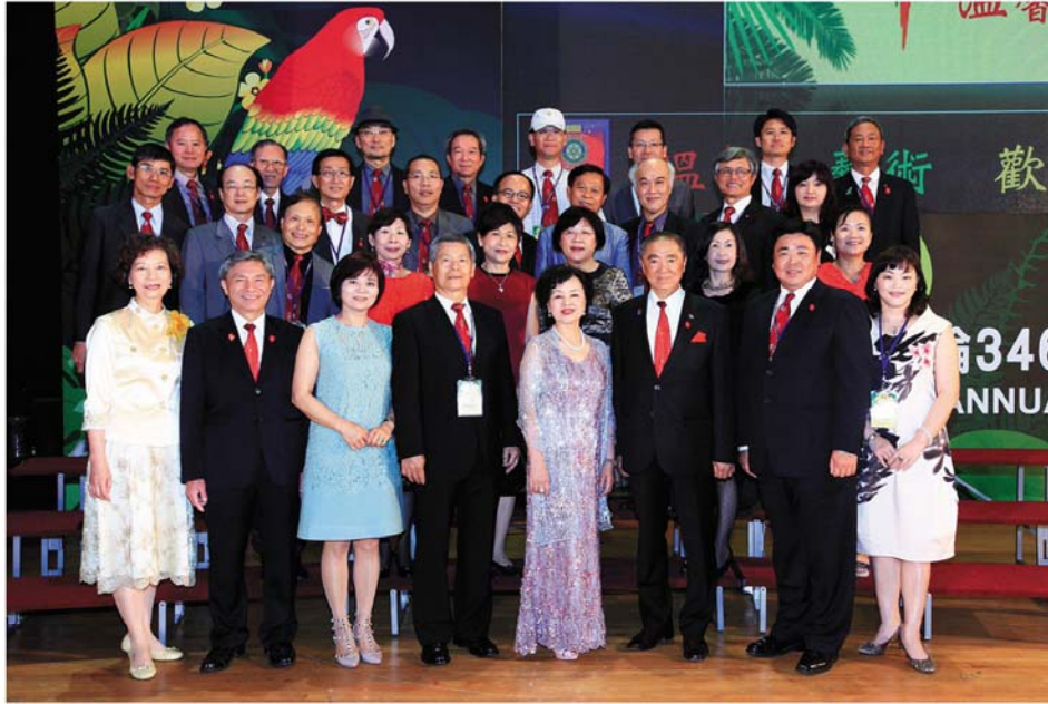
▲台中南門社與總監合照

上週第1065次例會，配合「第37屆區年會」在中興大學惠蓀堂舉行，時間變更為民國104年3月28-29日。