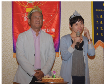
▲ARCHI夫人說很高興過生日，但是

PACKING節目主委請壽星走紅地毯出場，四月份壽星 EARS社友(4月1日)，SPORS社友(4月3日)，ARCHI 社友 (4月4日)，KENCHIKU夫人(4月8日)，DISK社友(4月15日)，RUDY社友、CATIA社友(4月22日)，ARCHI夫人(4月23日)。