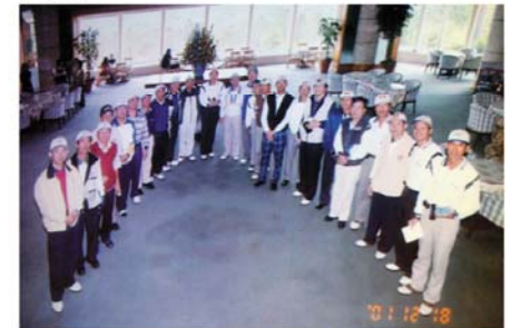
▲第七屆高爾夫活動

ARCHI代表壽星致詞，謝謝祝賀也已經吃了很多次蛋糕，ARCHI夫人說很高興過生日，但是隨著時