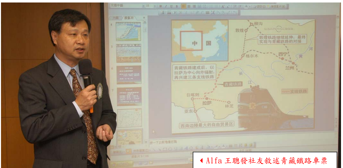
◀ Alfa 王聰發社友敘述青藏鐵路車票