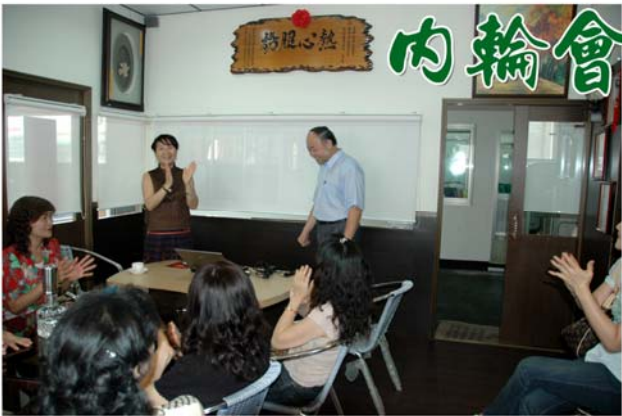
▲內輪會咖啡講座 98年5月16日