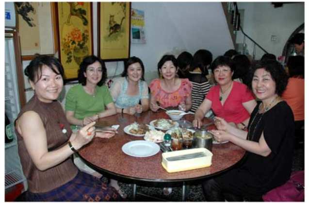
▲內輪會結束後大家前往湖南味吃小吃