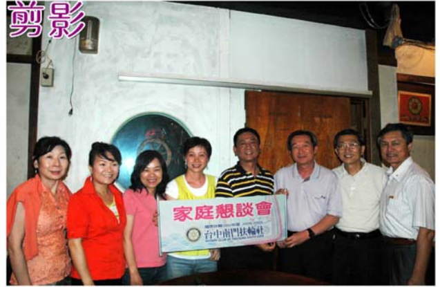
▲ARCHI 家庭懇談會 98年5月17日