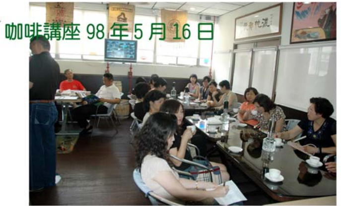
▲內輪會咖啡講座 98年5月16日