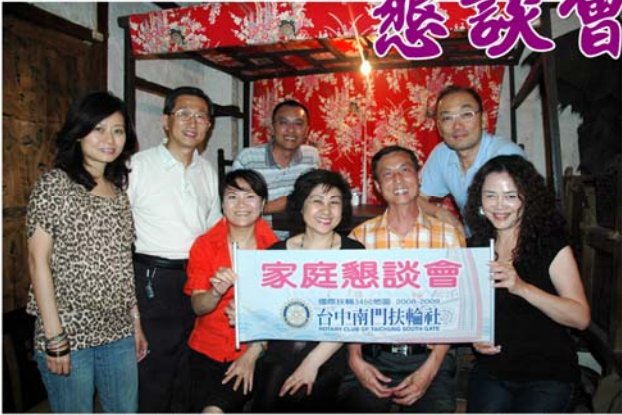
▲PLASTIC 家庭懇談會 98年5月17日