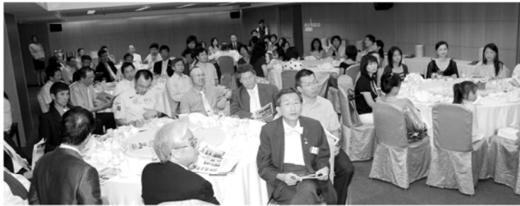
▲2009-10年度工作計劃報告例會

上週第765次例會，進行「年度工作計劃報告」，由各委員會主委、委員報告2009-10年度計劃執行的服務。