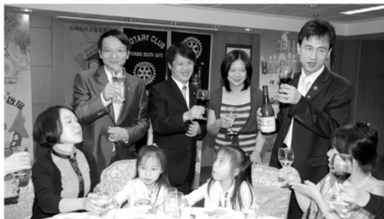
RICH帶領OnSen伉儷和社友與夫人認識