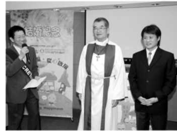
▼PHARMA前社長擔任監誓人