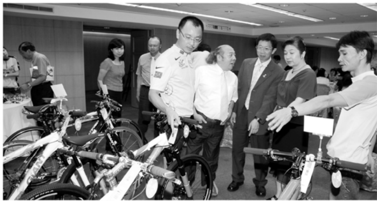
BIOTEK請單車公司派員展示各種款式的單車，讓社友選擇