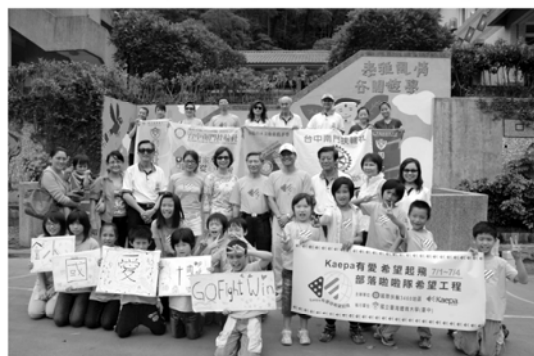
▲與博愛國小(谷關校區)小朋友合照