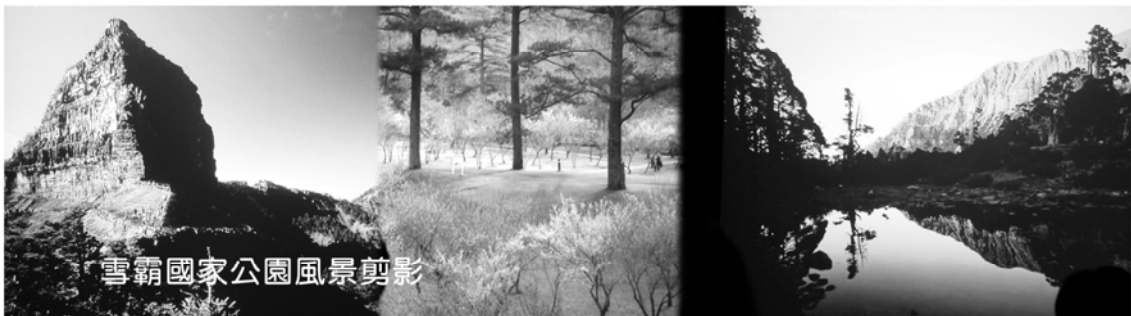
雪霸國家公園風景剪影

雪霸國家公園的集水區提供台灣東北部、北部、及中部的用水。區內有52種哺乳類動物，150種鳥類、26種爬蟲類、14種兩生類、16