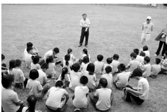
▲總監向和平國小小朋友精神喊話

台中南門扶輪社關懷偏遠地區小學的希望工程社區服務，7月4日(星期六)上午，與3460地區CONCEPT總監前往山地部落小學：台中縣和平國小、白冷國小、