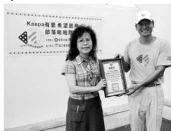
博愛國小(松鶴校區)校長致贈感謝狀給Kaepa社長▲