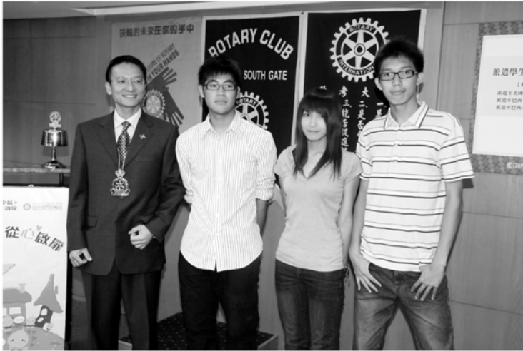
▲三綫位青少年交換派遣學生行前報告後合影

上 上週九十八年七月廿一日的第767次例會，安排「青少年交換派遣學生行前報告」。