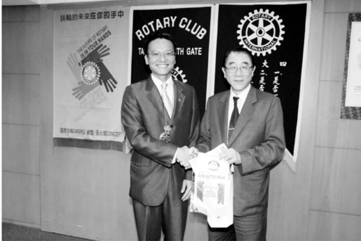
▲洪瑞松 教授演講：心臟冠狀動脈疾病之預防與治療

上 週九十八年七月廿八日的第768次例會，邀請洪瑞松教授做「心臟冠狀動脈疾病之預防與治療」專題演講。