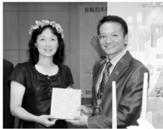
▼Biotek一席結婚週年感言，讓夫人熱淚盈眶、淚如雨下，感動列！