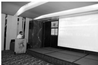
▲KNEADER「西洋音樂老歌賞析」