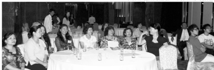
▼與石岡扶輪社聯合例會夫人聯誼

賽影片，也介紹德國萊特·施密特先生，現職為牧師及作家，參與七屆殘障奧運，贏過數十次國際賽金牌，10月份將來台訪問，10月18日會在東海大學演講。