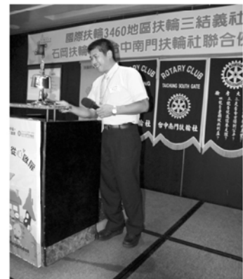
▲石岡社Steel社長鳴閉會鐘