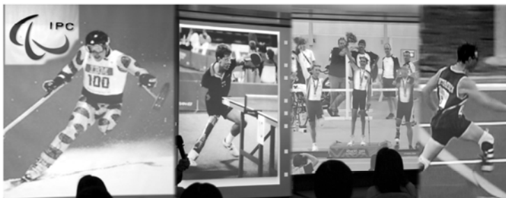
▲殘障奧運的比賽圖片

國際殘障奧運會是依付在國際奧林匹克運動會，申辦國家一定要同時負責舉辦不能放棄不辦，第一屆國際殘障奧運會1960在義大利羅馬舉行，2000雪梨殘障奧運會包括肢體障礙、視障、智障，2004雅典、2008北京的殘障奧運會不包括智障。而聽障者有自己的奧運會，2009聽障奧運在台北舉行，不過它並不是國際殘障奧運會的正式比賽，但能夠舉行各種殘障運動會，就是重視人權的表現。