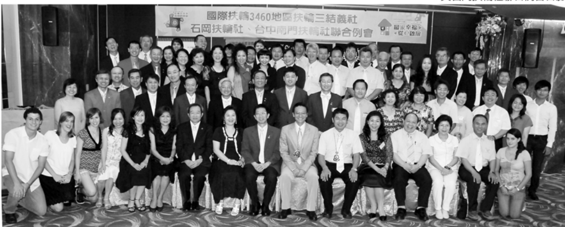
▼與石岡扶輪社聯合例會合影