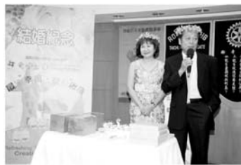
▲ALUMI說要讓彼此生活過得愉快！

ALUMI被COPPER要求做真情告白，他說「這很難講的！講得好就沒問題，講不好晚上睡覺時應該會很難過！追她追了五年，帶給我很多快樂，這一路走來她很忍耐我，如今當了阿公、阿嬤，已經沒有愛不愛的問題，而是要讓彼此生活過得愉快！」