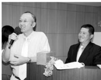
▲GIFT說，我們是在網球場上認識的