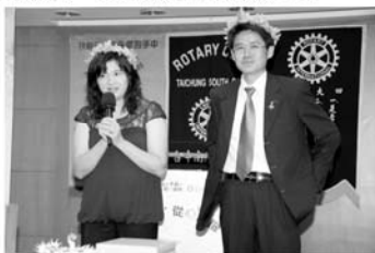
▲KING夫人說「我就是要洪富金！」

KING說「我們的結婚年數，只是許多社友的零頭，需要學習的還很多，大家要多多指教！」