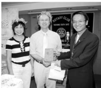
▲GIFT伉儷八月結婚紀念

GIFT說上週八月慶生會，我帶了二次一桿進洞證書還有球，以及當選彰化球場Champion選手的證書，COPPER要求值得懷念的證據，追太太的話語已經消失無法留