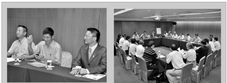
九月 STAR會議 由CONCORD主持談「YEP的權利義務」