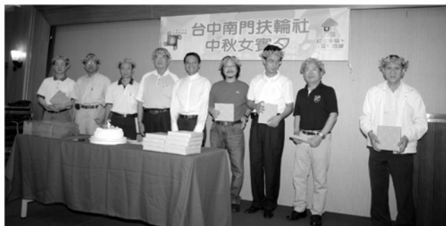
表揚社友子女金榜題名