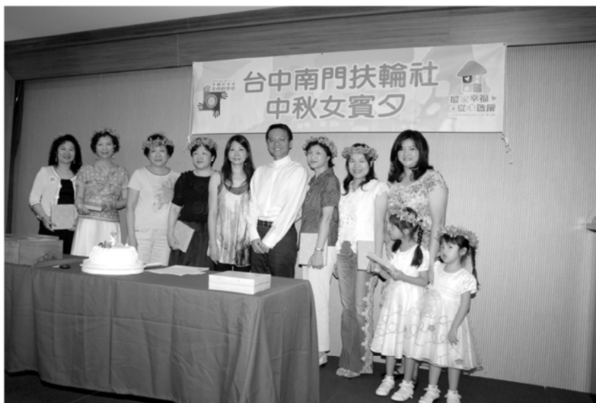
▲中秋女賓夕晚會安排慶祝十月份社友生日和結婚紀念

上週第778次例會，舉行「中秋金賓夕」，變更到南投南豐高爾夫球場舉行。安排慶祝十月份社友生日和結婚紀念。