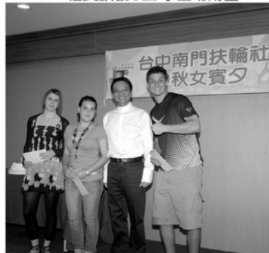
▼社長頒發YEP學生零用金