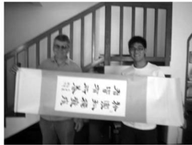
▲我在父親節送書給轟爸!!!他很開心外交使節的責任啦！

巴西人真的很愛玩，我的home parents利用週末三天帶我去露營。這露營可不是台灣的露營，有營地，有廁所及浴室的那種露營。這種露營是野外求生的那種，你在電影上才看得到的露營。在台灣我從來沒露過營，這次的露營，對我可是一大挑戰，要自己煮飯，睡帳篷還是小事，最叫我不知所措的是我們要去河邊洗菜、洗碗、挑河水來煮飯，還要跳進河裡洗澡、游泳。只差沒把尿尿也尿進河裡。真是夠簡單的生活了！我們還在河裡划船，欣賞美麗的風景，悠閒的和朋友聊天、玩樂，這場景真的只有