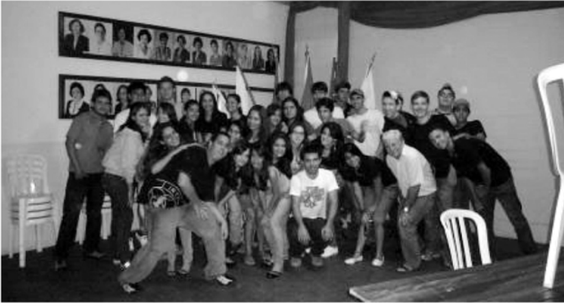
▲在這裡不同年齡參加不同名稱的扶輪社，1~12參加Rotary Kids 13~18參加Interact 19~26參加Rotaract，中年以上參加Rotary，而且扶輪的太太們也有自己的組織而這張照片是Interact我現在也是其中一員