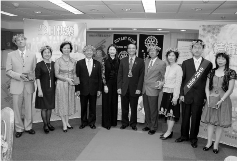
▲十一月份結婚紀念

上週第782次例會舉行「十一月份慶生會」，KAEP A社長特別邀請CONCEPT總監分享這幾個月到各社公式訪問的甘苦談。