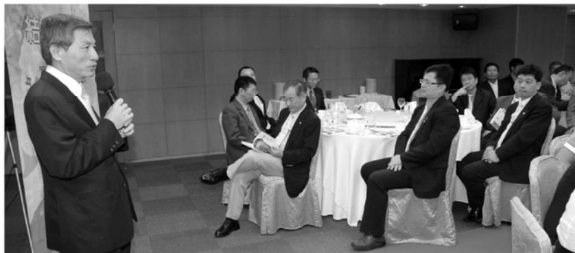
▲CONCEPT總監分享這幾個月到各社公式訪問的甘苦

ALUMI報告高爾夫安排，13日大東中央社、14日新店碧潭社，禮品已經安排妥當。