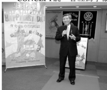
▲CONCEPT總監感謝社友支持

調社務忙到深夜二點，也曾經為了例會時間講到心中有氣，還有在談話中感受踩到別人紅線的氣氛。擔任總監職務是自願的，打哈哈可以過一年，但既然做了，其實認真做對大家更有幫助。