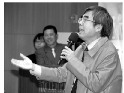
▲大同社Meta特別獻唱「愛你」新歌