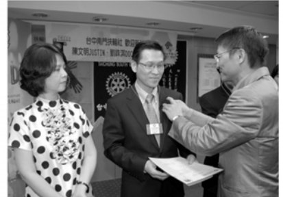
▲社長為新社友配戴扶輪徽章