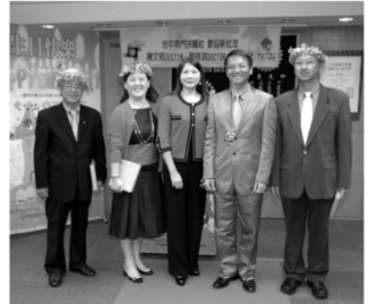
▲十二月壽星 ▼十二月結婚紀念