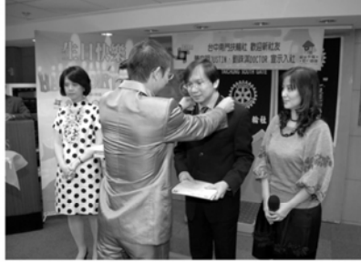
▲社長為新社友配戴扶輪徽章