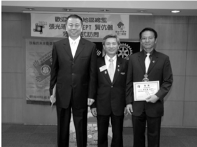
▲扶輪基金鉅額捐款社友

· 本年度捐獻扶輪基金成爲鉅額捐款的社友3位：CONCEPT、KAEPA、EMERSON。