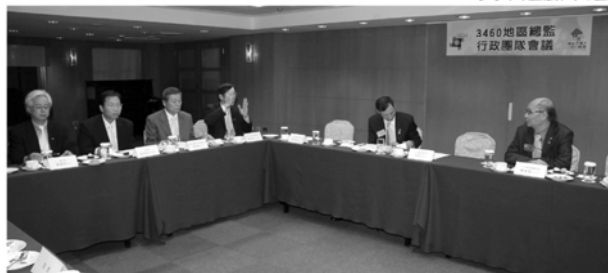
▲地區團隊與五大主委座談