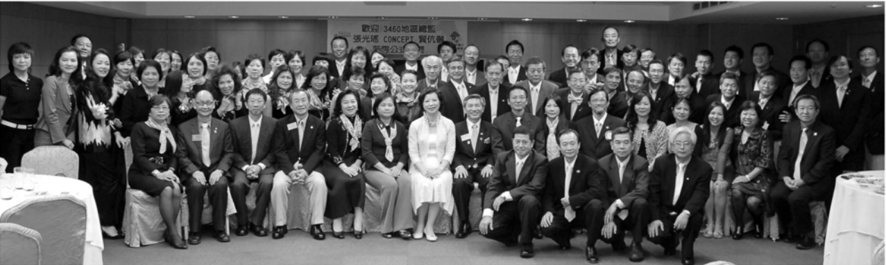
▼大家與總監合影留念