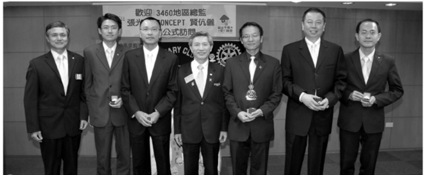
▲捐中華扶輪教育基金社友