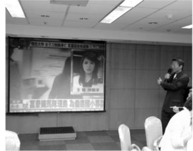
▼電視台播出自行車為學童募款新聞