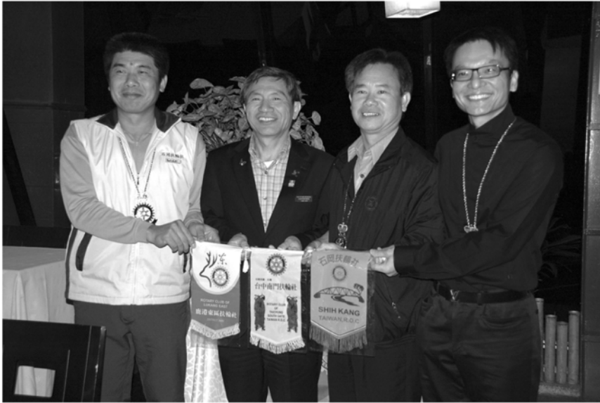
▲三結義社三社社長交換社旗合影