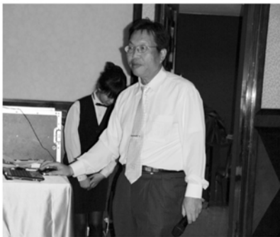
▲KNEADER費心準備了許多猜謎題目

腦筋急轉彎) 正解：樹不會跳為何用秤 (射：四個字成語) 正解：不知輕重欲射苦無箭 (射：一個字) 正解：彈男人小便 (射：數學名詞) 正解：立方八十歲照鏡子 (射：國語歇後語) 正解：老樣子