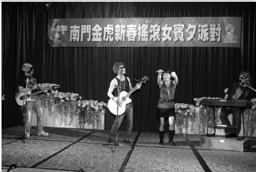
▲BIOTEK扮演六百，率領由KING、PACKING組成的Taiwan Blue樂團

上週798次例會，配合舉行「庚寅金虎年新春女賓夕」，時間變更為九十九年二月廿七日(星期六)，地點變更到台中長榮桂冠酒店。