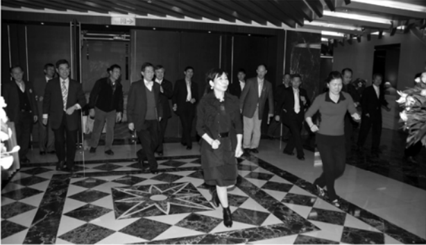
▼區年會「扶輪之夜」帶出總監家人節目練習