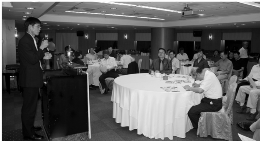
▲年度 Close Meeting

上週九十九年四月二十日的第806次例會，進行「年度Close Meeting」。