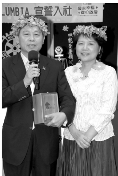
▲LIVING伉儷發表結婚29週年感言

司儀COPPER請LIVING伉儷發表感言，LIVING說結婚已經29週年，往後還是需要更用心更認真經營。LIVING夫人說，感謝