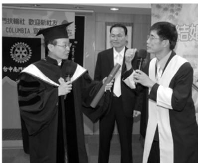
▼COLUMBIA粘森榮社友宣誓入社

COLUMBIA粘森榮的入社歡迎式，由LAWYER著學士服、CONCORD穿著法庭中的律師服，敘述哥倫比亞大學眼光看要加入台中南門扶輪社，台中南門社是優質社，15年產生一位區總監，選擇加入，有眼光。