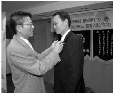
▲社長為COLUMBIA配戴扶輪徽章

COLUMBIA的入社宣誓，由LAWYER帶領宣讀誓詞，創社長CONCEPT總監擔任監督人，全體社友起立觀禮，歡迎生力軍加入南門社。KAEPA社長為他配戴扶輪徽章。