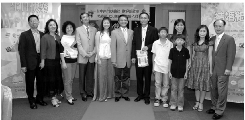
▲COLUMBIA粘森榮社友宣誓入社後合影留念