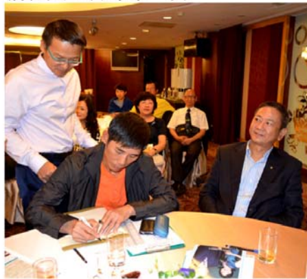
▲提名委員會主委KAEPa選票封存

2015-16社長選舉，由提名委員會主委KAEPa負責收集選票裝袋封存，並請提名委員在封條簽名，將於適當時間共同開封統計。