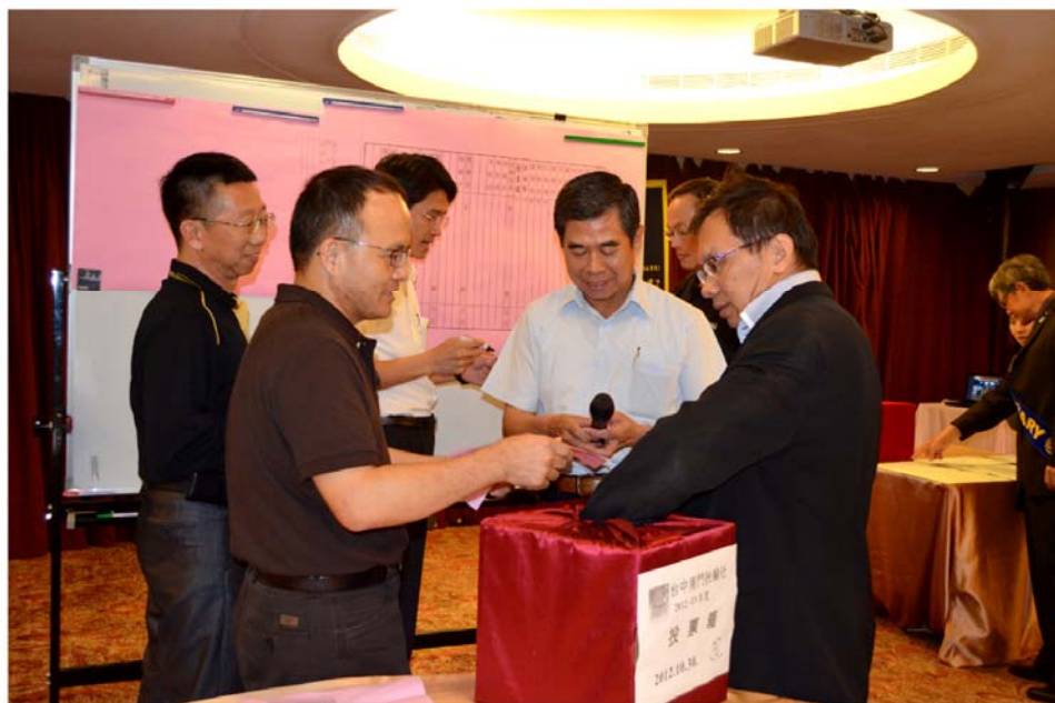
▲2013-14年度理事選舉，開票

上 週民國101年十月三十日的第938次例會，舉行「2013-14年度理事選舉」。