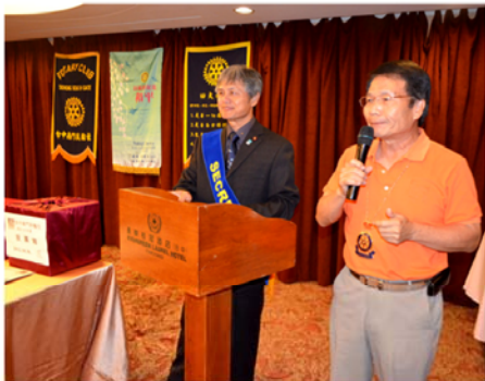
▲SPORTS社長主持年度理事選舉

秘書報告：請EARS、POSTER分發選票，JUSTIN、LOBSANG負責唱票，KING和COLUMBIA計票，CATIA和GARY監票。