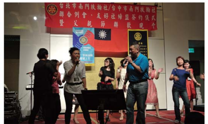
台中南門社表演舞蹈 兩社聯誼