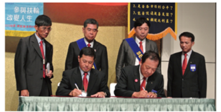
▲友好社締盟簽約儀式