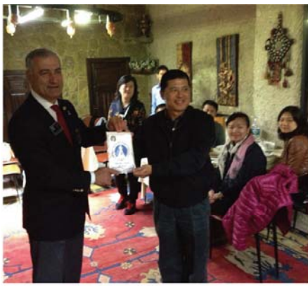
▲和當地扶輪社餐敘

歷史的大型地下水庫，就像宮殿一般。真佩服古時候的人，在遠古時代，沒電沒挖土機，可以蓋出如此龐大的建築。