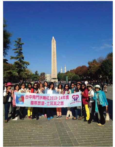
▲蔚藍的天映著雄偉的方尖碑

另一個讓人嘆為觀止的自然景觀是卡帕多奇亞，一個個矗立在荒原上的奇岩怪石，真像外星人的世界，彷彿在另一個星球上。尤其我們坐著熱氣球，從高空俯瞰這些奇岩怪石，更覺得震撼。坐熱氣球又是一個讓我們難忘的美好經驗。雖然一大早就得起床，冒著 10^{\circ}\text{C} 的低溫，發抖著登上熱氣球，但是當氣球升空的那一剎那，我們知道一切的辛苦都是值得的。