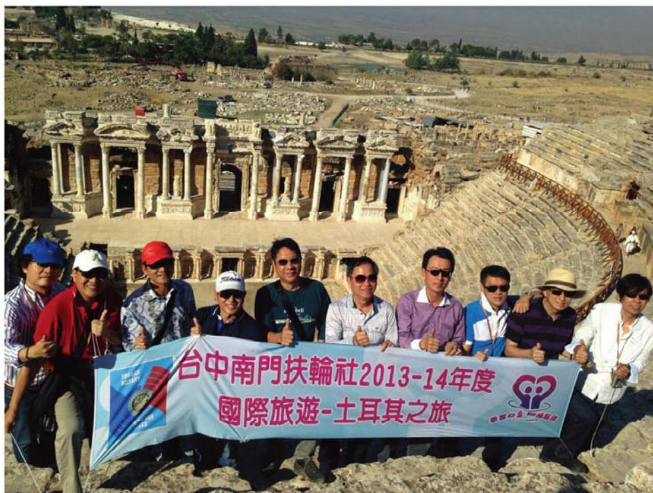
▲千年前容納數萬人的表演場

第二天去皮衣工廠，我們創造了一項南門奇蹟。24個人居然買了21件皮衣。連導遊都說從沒看過這麼浩大的採購團。雖然沒有殺價成