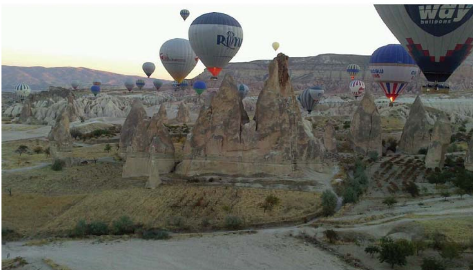
▲卡帕多奇亞的奇岩怪石