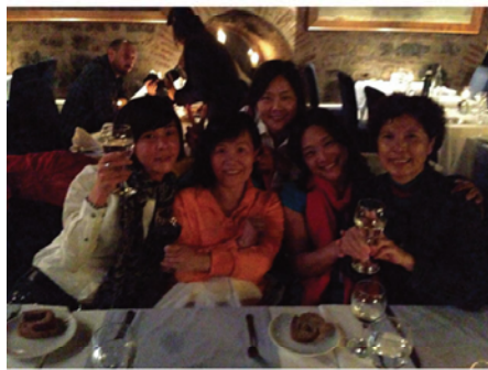
▲少女塔浪漫的晚宴

伯斯普魯斯海峽的遊船，也是讓人難忘的回憶，再度創了一個南門奇蹟。一個半小時的遊船，在大家拍足了相片，看夠了風景之後，不甘寂寞的南門歌舞團又開張了。由社長首先獻唱一首歌，接著南門