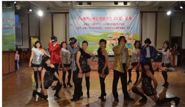
授證十九週年慶典 剪影